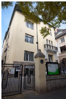
OK Oktatási Központ